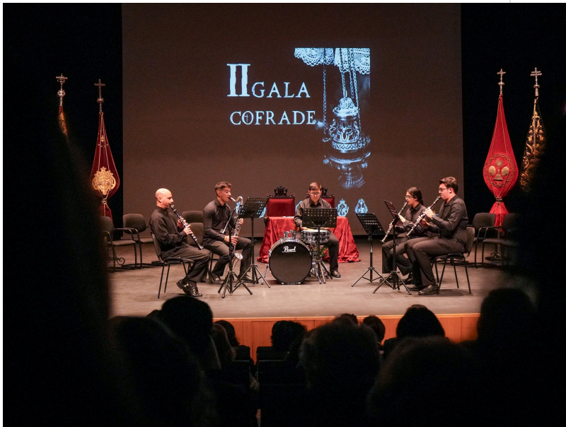
( http://www.almonte.es/export/sites/almonte/es/.galleries/imagenes-noticias/Noticias-2026/Marzo/Dia-28/Gala-Cofrade-2026-5.jpg )