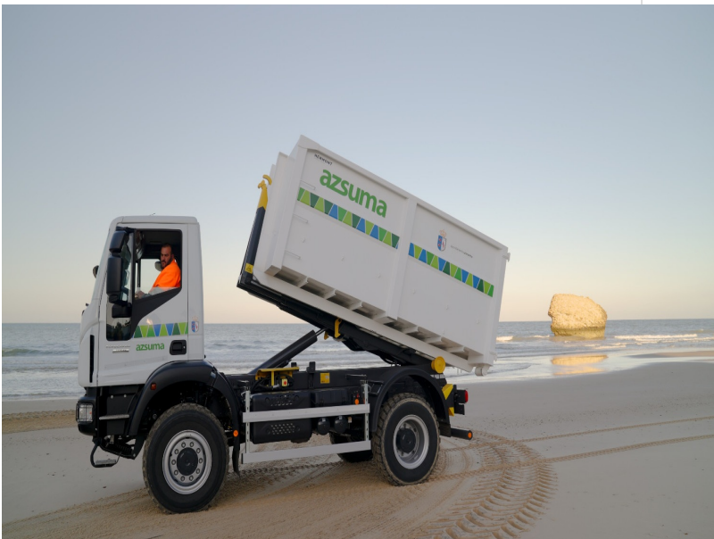
( http://www.almonte.es/export/sites/almonte/es/.galleries/imagenes-noticias/Noticias-2026/Abril/Dia-02/Limpiezaplaya.jpg )