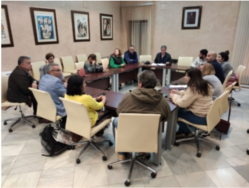
( http://www.almonte.es/es/.galleries/imagenes-noticias/Noticias-2020/Marzo/Dia-14/WhatsApp-Image-2020-03-14-at-23.23.31-3.jpeg )