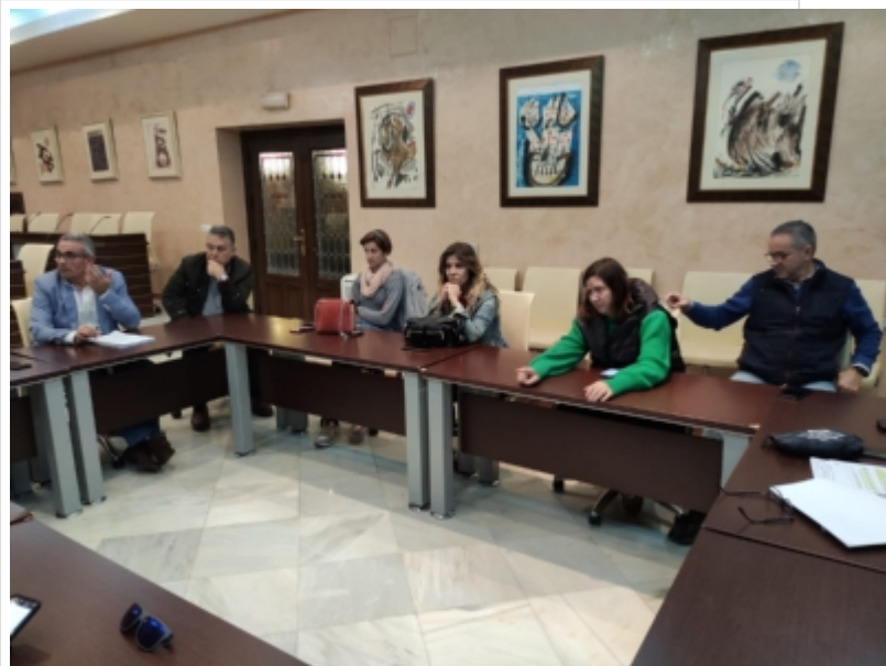
( http://www.almonte.es/es/.galleries/imagenes-noticias/Noticias-2020/Marzo/Dia-14/WhatsApp-Image-2020-03-14-at-23.23.31-2.jpeg )