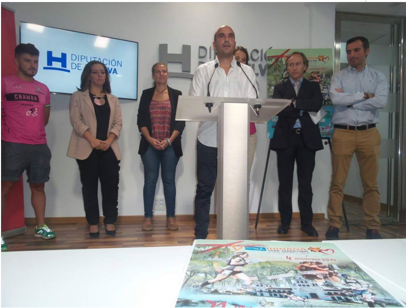
( http://www.almonte.es/export/sites/almonte/es/.galleries/imagenes-noticias/noticias-2017/Octubre/Dia-24/2/Presentacion-V-Donana-Trail-Ma )