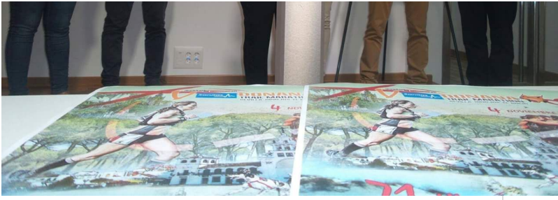
( http://www.almonte.es/export/sites/almonte/es/.galleries/imagenes-noticias/noticias-2017/Octubre/Dia-24/2/Presentacion-V-Donana-Trail-Ma )