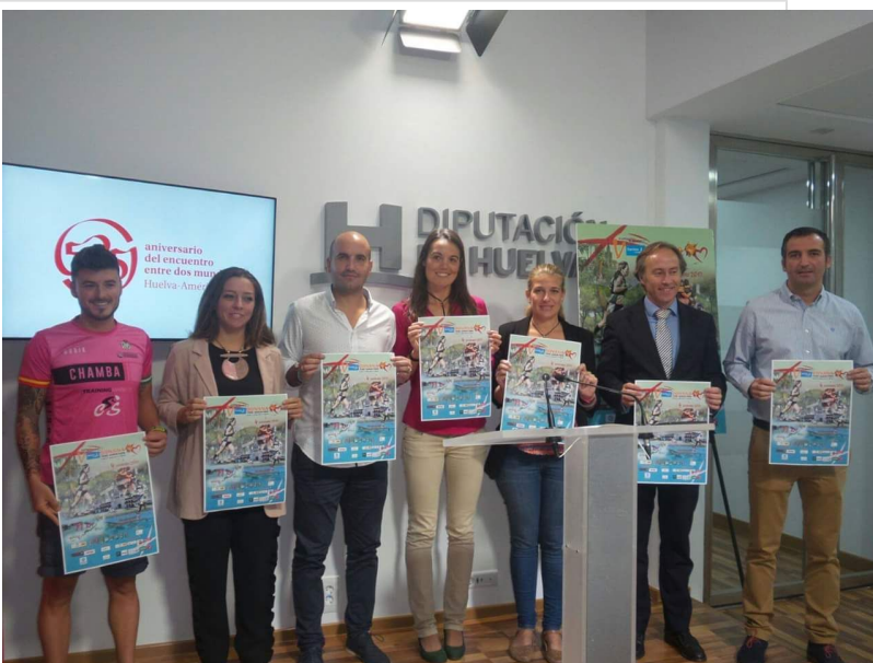
( http://www.almonte.es/export/sites/almonte/es/.galleries/imagenes-noticias/noticias-2017/Octubre/Dia-24/2/Presentacion-V-Donana-Trail-Ma )