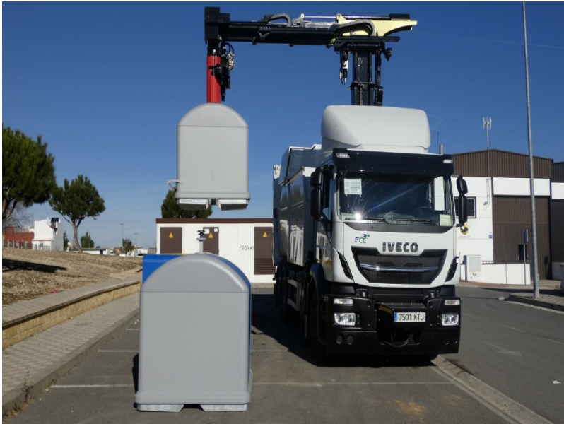
( http://www.almonte.es/export/sites/almonte/es/.galleries/imagenes-noticias/noticias-2019/Febrero/Dia-8/recogida-de-basura-y-limpieza-3.jpg )