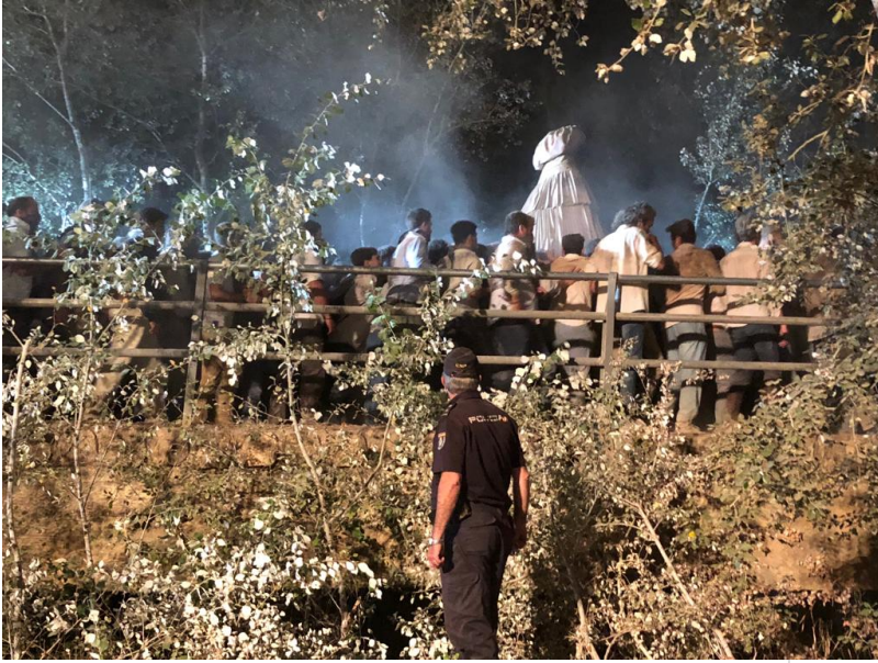
( http://www.almonte.es/export/sites/almonte/es/.galleries/imagenes-noticias/noticias-2019/Agosto/Dia-23/paut-virgen.jpg )