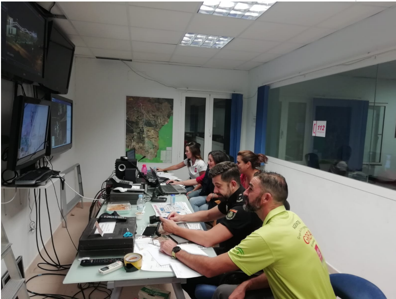
( http://www.almonte.es/export/sites/almonte/es/.galleries/imagenes-noticias/noticias-2019/Agosto/Dia-23/cecop-2.jpg )