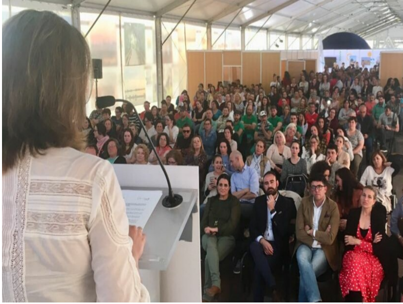
( http://www.almonte.es/export/sites/almonte/es/.galleries/imagenes-noticias/Noticias-2018/Abril/Dia-29/Presentacion-certificado-B-Corp-4.jpg )