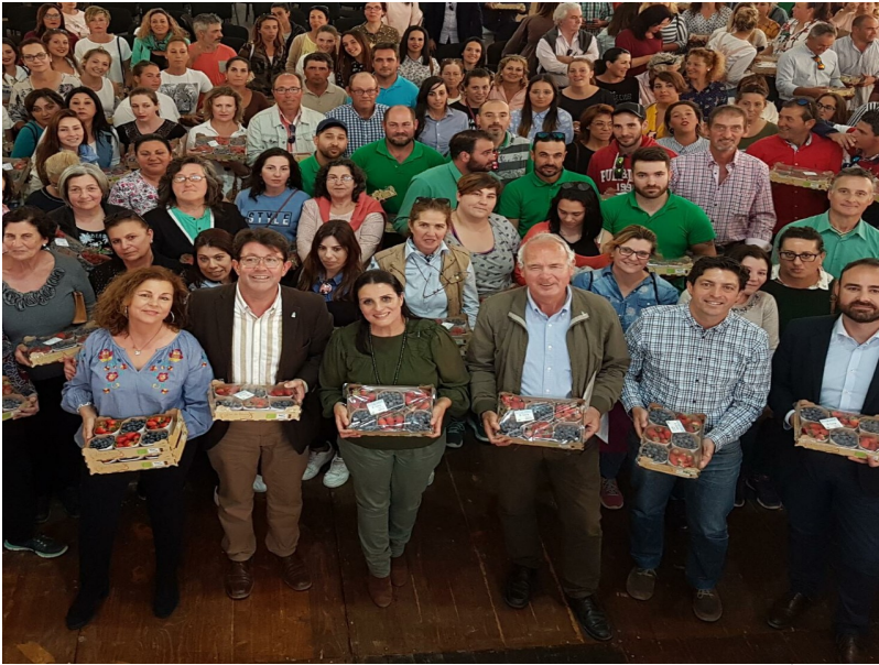
( http://www.almonte.es/export/sites/almonte/es/.galleries/imagenes-noticias/Noticias-2018/Abril/Dia-29/Presentacion-certificado-B-Corp-2.jpg )