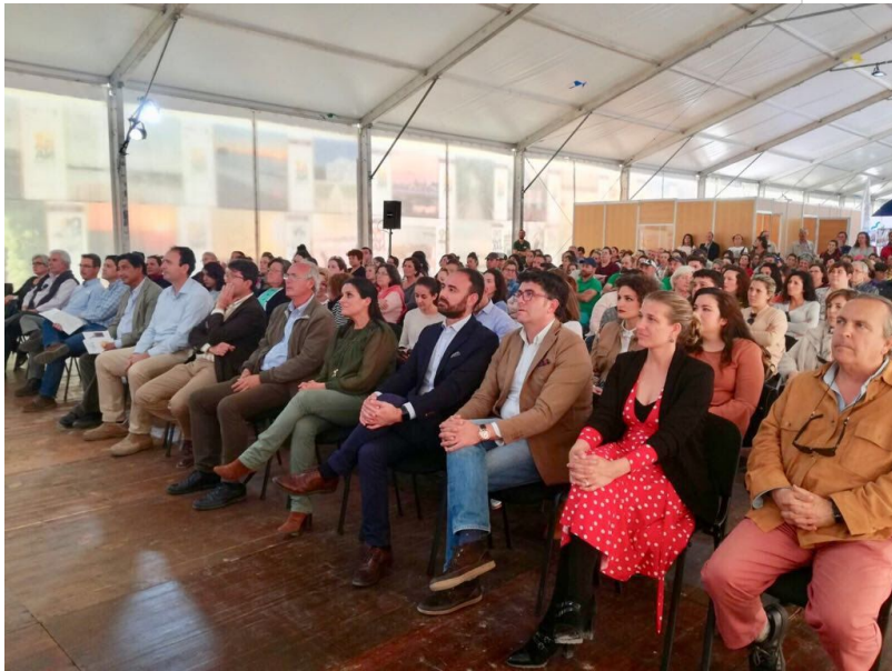
( http://www.almonte.es/export/sites/almonte/es/.galleries/imagenes-noticias/Noticias-2018/Abril/Dia-29/Presentacion-certificado-B-Corp-3.jpg )