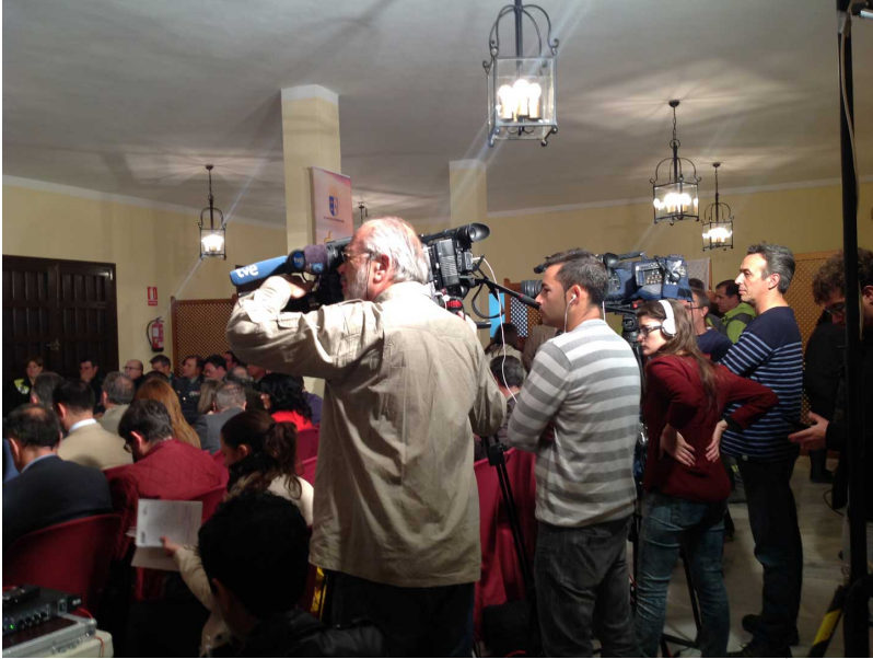
( http://www.almonte.es/export/sites/almonte/es/.galleries/imagenes-noticias/noticias-2016/Mayo/Dia-13/IMG_0016.jpg )