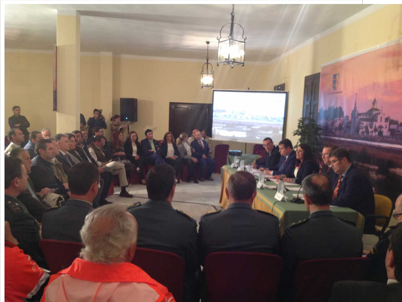
( http://www.almonte.es/export/sites/almonte/es/.galleries/imagenes-noticias/noticias-2016/Mayo/Dia-13/IMG_0008.jpg )