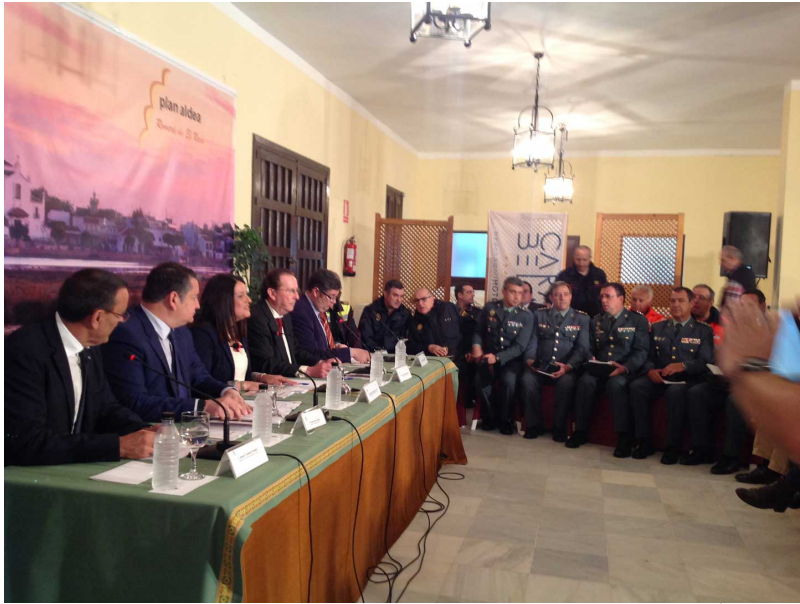
( http://www.almonte.es/export/sites/almonte/es/.galleries/imagenes-noticias/noticias-2016/Mayo/Dia-13/IMG_0006.jpg )