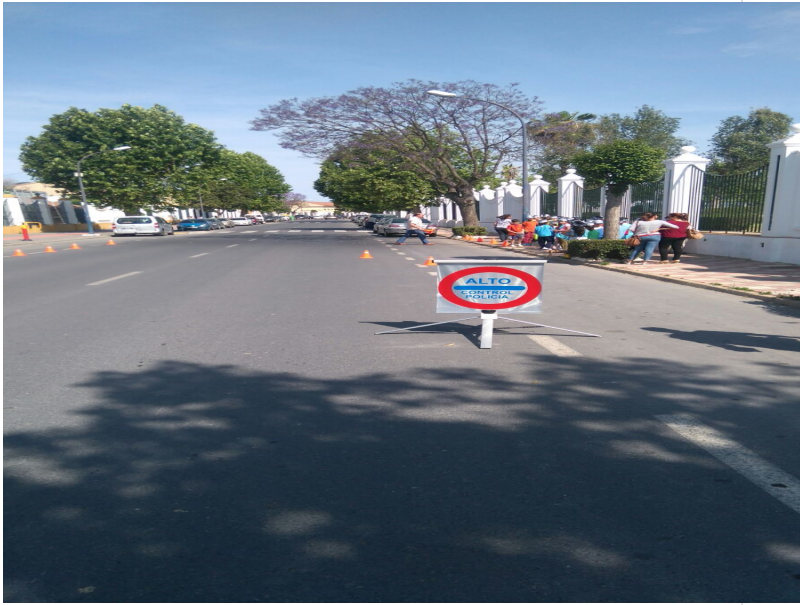
( http://www.almonte.es/export/sites/almonte/es/.galleries/imagenes-noticias/noticias-2016/Mayo/Dia-24/Educacion-Vial.jpg )