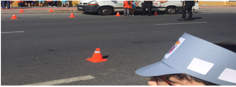
( http://www.almonte.es/export/sites/almonte/es/.galleries/imagenes-noticias/noticias-2016/Mayo/Dia-24/la-foto-3.JPG )