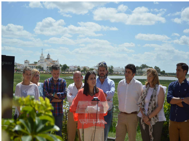
( http://www.almonte.es/export/sites/almonte/es/.galleries/imagenes-noticias/noticias-2016/Junio/Dia-15/saca/Presentacion-Cartel-Saca-Yeguas-2 )