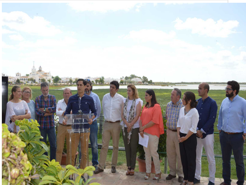
( http://www.almonte.es/export/sites/almonte/es/.galleries/imagenes-noticias/noticias-2016/Junio/Dia-15/saca/Presentacion-Cartel-Saca-Yeguas-2 )