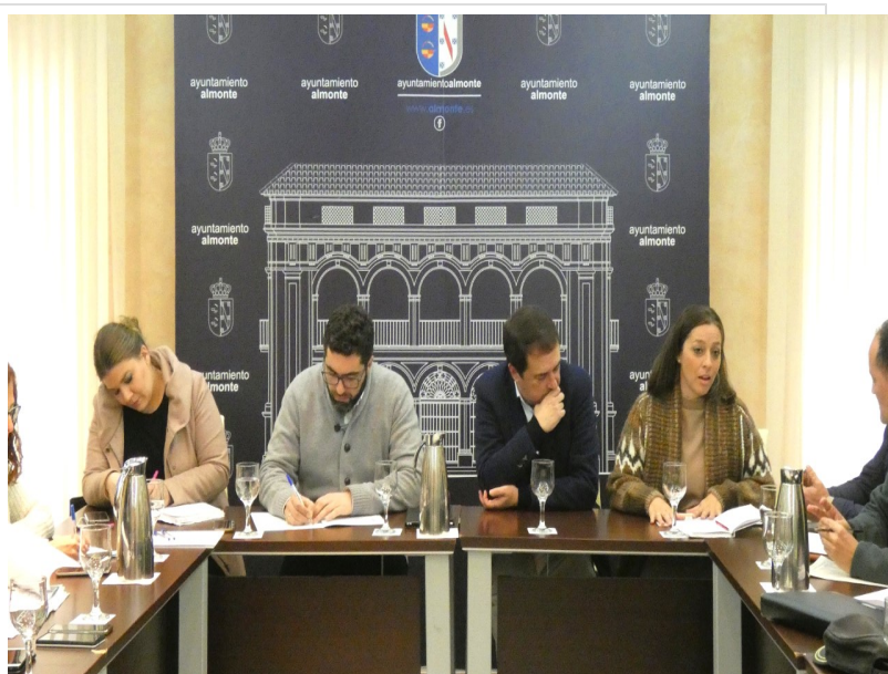
( http://www.almonte.es/export/sites/almonte/es/.galleries/imagenes-noticias/noticias-2019/Enero-2019/Dia-10/Reunion-Plan-Emergencias-2.jpg )

Asimismo, el tiempo de respuesta ante un incidente se redujo en un 82 por ciento, al pasar de 22 a 4 minutos de media, por lo que, para la alcaldesa de Almonte, Rocío Espinosa, el balance fue “muy positivo, especialmente desde el punto de vista de la seguridad, pero también desde el punto de vista del disfrute de todas las personas que visitaron la aldea”, en la que ese fin de semana se concentran más de 15.000 caballos, varios miles de carros y más de 200.000 personas, por lo que “el uso del coche es incompatible con garantizar la seguridad”, ha añadido.