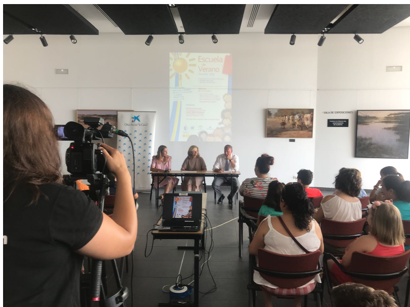
( http://www.almonte.es/export/sites/almonte/es/.galleries/imagenes-noticias/Noticias-2018/Julio/Dia-12/2/Escuela-de-Verano-3.jpg )