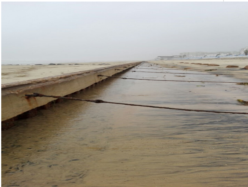
( http://www.almonte.es/export/sites/almonte/es/.galleries/imagenes-noticias/Noticias-2018/Marzo/Dia-11/Temporal-en-Matalascanas-4.jpg )