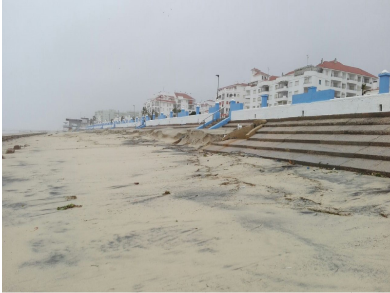
( http://www.almonte.es/export/sites/almonte/es/.galleries/imagenes-noticias/Noticias-2018/Marzo/Dia-11/Temporal-en-Matalascanas-3.jpg )