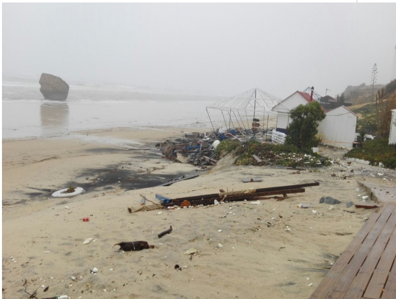
( http://www.almonte.es/export/sites/almonte/es/.galleries/imagenes-noticias/Noticias-2018/Marzo/Dia-11/Temporal-en-Matalascanas-2.jpg )