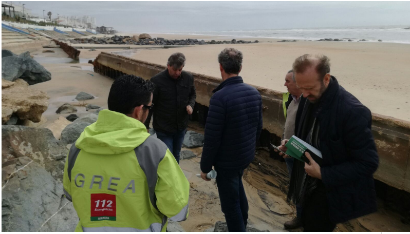
( http://www.almonte.es/export/sites/almonte/es/.galleries/imagenes-noticias/Noticias-2018/Marzo/Dia-11/Temporal-en-Matalascanas-5.jpg )