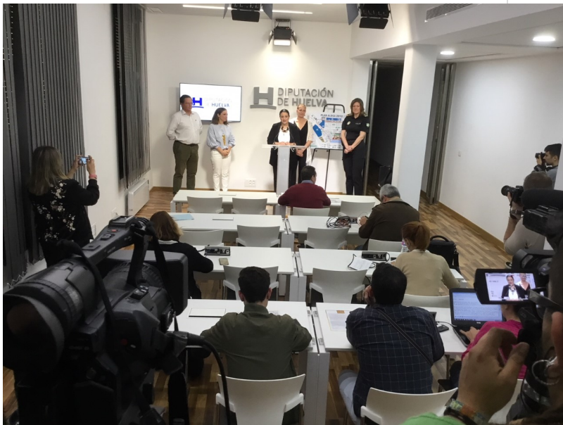
( http://www.almonte.es/export/sites/almonte/es/.galleries/imagenes-noticias/Noticias-2018/Mayo/Dia-10/Presentacion-Bando-2.jpg )