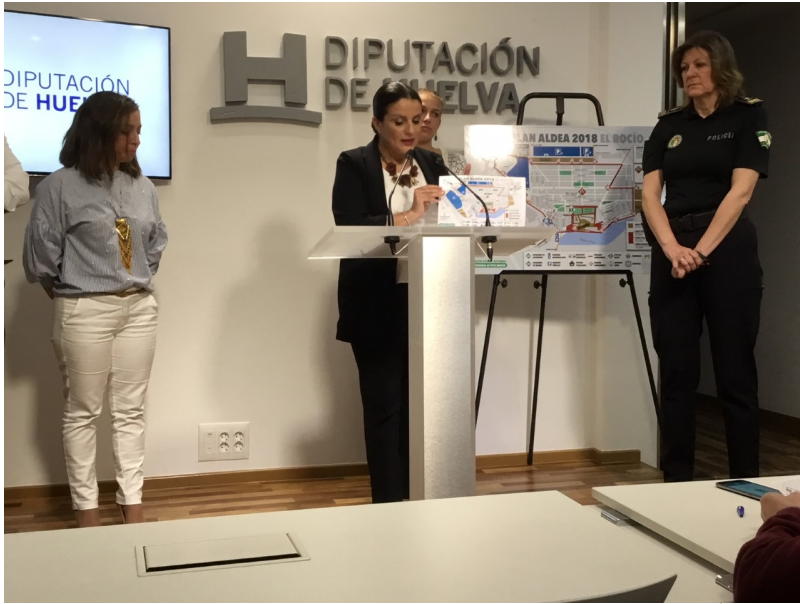
( http://www.almonte.es/export/sites/almonte/es/.galleries/imagenes-noticias/Noticias-2018/Mayo/Dia-10/Presentacion-Bando-4.jpg )