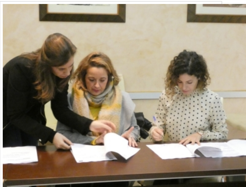
( http://www.almonte.es/es/.galleries/imagenes-noticias/noticias-2019/Febrero/Dia-4/Contrataciones-planes-de-empleo-2.jpeg )

Por último, la regidora almonteña ha agradecido la “apuesta” de la Junta de Andalucía por la creación de empleo en los municipios a través de este programa, por lo que ha mostrado sus deseos de que estos planes continúen en próximos ejercicios con el nuevo Gobierno andaluz.