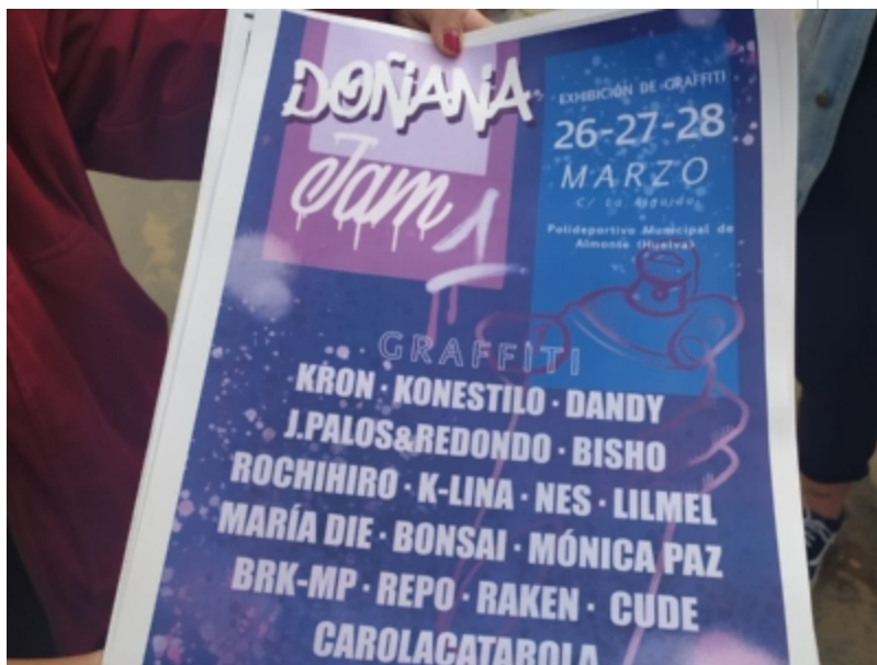
( http://www.almonte.es/es/.galleries/imagenes-noticias/Noticias-2021/Marzo/Dia-04/WhatsApp-Image-2021-03-04-at-14.15.46-2.jpeg )