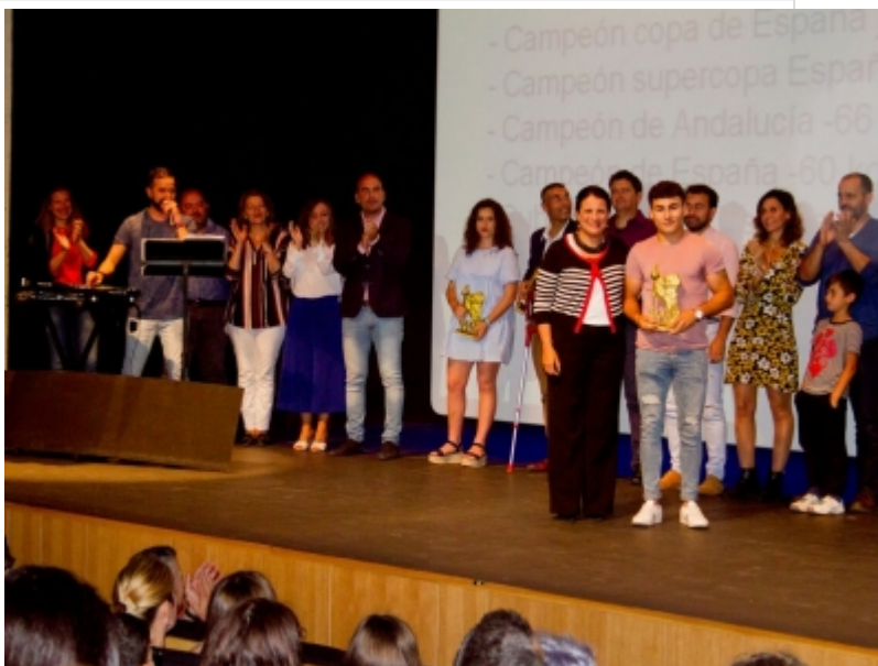
( http://www.almonte.es/es/.galleries/imagenes-noticias/Noticias-2018/Junio/Dia-10/Gala-del-Deporte-2.jpeg )