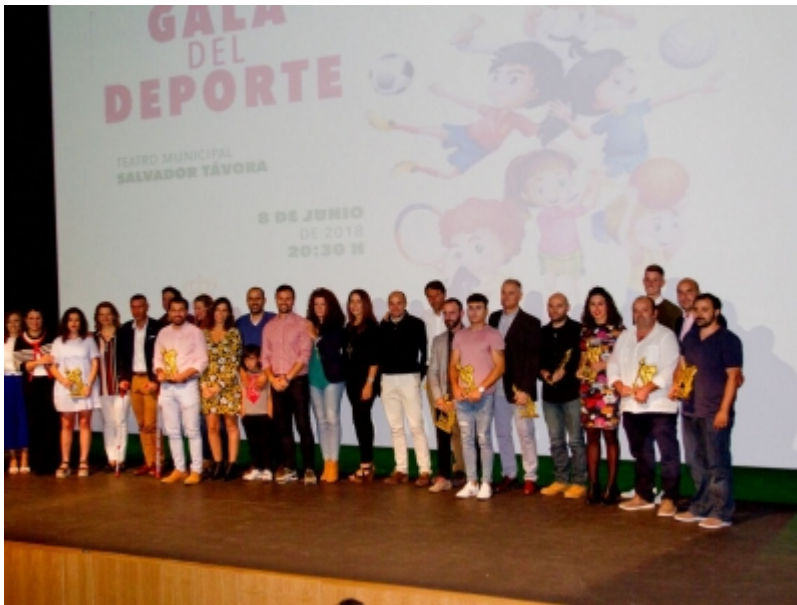
( http://www.almonte.es/es/.galleries/imagenes-noticias/Noticias-2018/Junio/Dia-10/Gala-del-Deporte-3.jpeg )